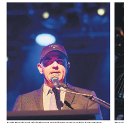
Den richtigen Sound zur richtigen Zeit – seit 40 Jahren eine Herausforderung.

Rede zu halten, denn gegen ihr «Und jetzt: Wenn ihr den Bundespräsidenten für eine Rede einladet, dann seid ihr wirklich Punks», so Berset.