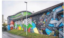
Das Fri-Son auf der Seite der Industriestrasse.

Die beiden servieren einen wilden, markantesten Punk und werden für einen energiegeladenen Abschluss des Festivals sorgen. Für das «Block Fest» haben Crème Solaire eine spezielle Show mit einigen Überraschungen vorbereitet.