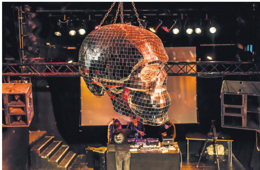
Die grosse Discokugel Skully ist über die Jahre zum Symbol für das Fri-Son geworden.