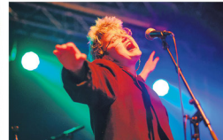
Tritt am Samstagabend auf: die Band Crème Solaire.

Industriestrasse gesperrt Zu den beiden Jubiläumstagen im Fri-Son kommt für das Festival eine Aussenbahn auf der Industriestrasse dazu. «Während des Festes wird die Industriestrasse für das Wochenende zu sperren, damit wir das Fest auch näher ins Quartier bringen können», so Romanens. «Neben der Bühne wird es auch eine zusätzliche Bar sowie Foodtrucks mit